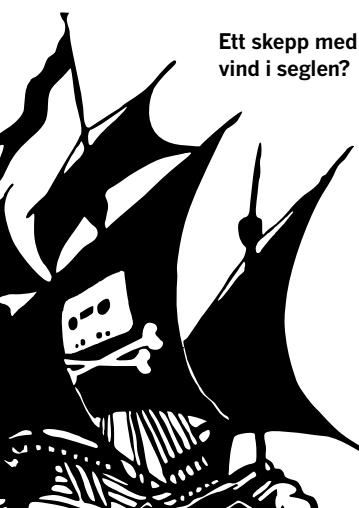
Ett skepp med vind i seglen?

► Uppladdning. Att göra något tillgängligt för andra att ladda ner.